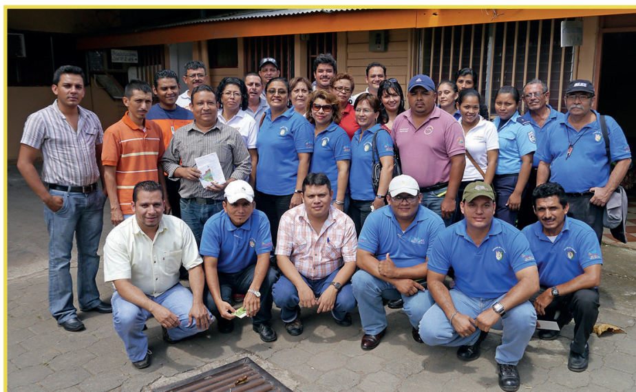
Equipo Técnico Municipal de la Subcuenca Mayales