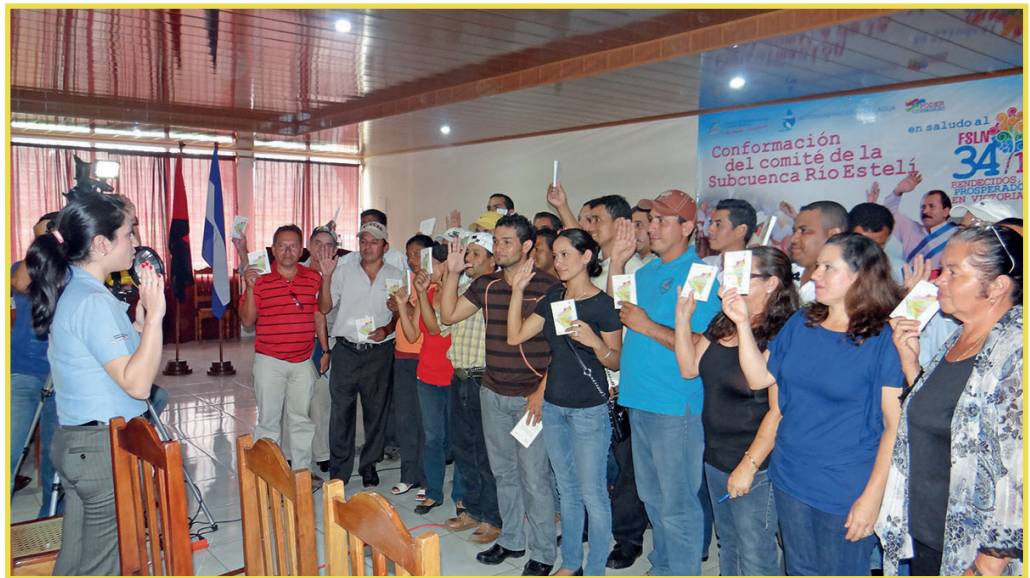
Juramentación del Comité de la Subcuenca Río Estelí. 2013

Un funcionario o funcionaria de la ANA, realiza la juramentación y se procede a elaborar el acta de conformación del comité.